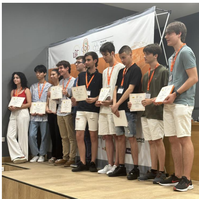
Estudiants premiats a la XIV Olimpíada Espanyola d'Economia. Sevilla, 2023.