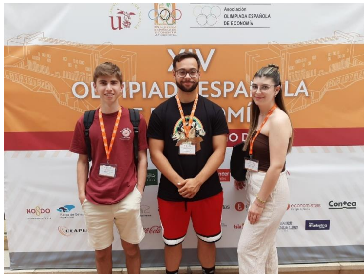
Estudiants classificats en les tres primeres posicions de la Fase Local de la XIV Olimpíada d'Economia

Els centres amb millor qualificació mitjana per als seus tres estudiants més ben classificats/des de la Fase Local de la XIV Olimpíada han estat: l' Institut Antoni de Martí i Franquès (Tarragona), seguit de l' Institut Ramon Berenguer IV (Cambrils) i el Col·legi Vedruna Sagrat Cor (Tarragona).