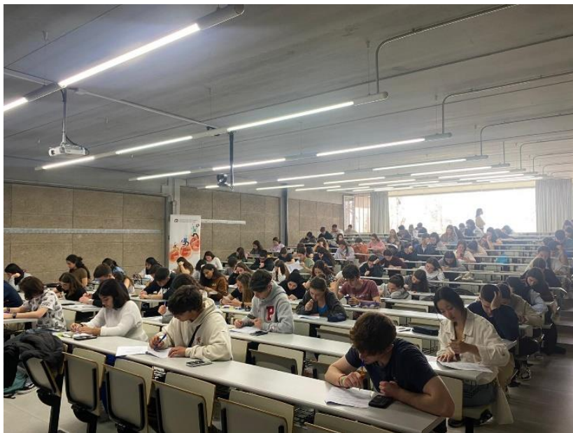
Participants a la prova de la Fase Local del curs 2022-23. FEE, 30 de març de 2023.

En el curs 2022-23 la Fase Local es va dur a terme el 30 de març de 2023. Hi van participar 83 estudiants de 18 centres de secundària de la província de Tarragona.