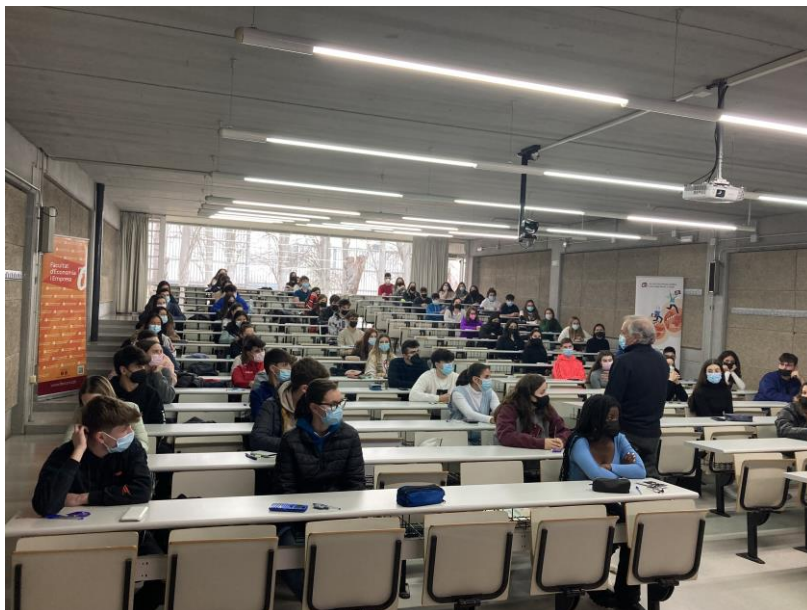
Participants a la prova de la Fase Local del curs 2021-22. FEE, 24 de març de 2022.

En el curs 2021-22 la Fase Local es va dur a terme el 24 de març de 2022. Hi van participar 75 estudiants de 19 centres de secundària de la província de Tarragona. En aquesta edició es va recuperar la normalitat prèvia a la pandèmia de la Covid-19 i la prova es va realitzar de forma presencial.