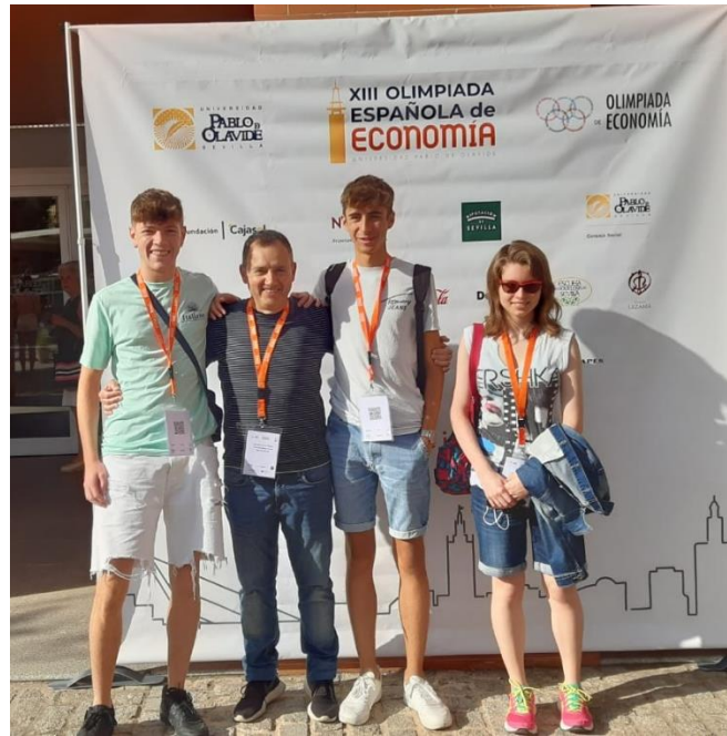
Estudiants classificats en les tres primeres posicions de la Fase Local de la XIII Olimpíada d'Economia amb el seu professor.

Els centres amb millor qualificació mitjana per als seus tres estudiants més ben classificats de la Fase Local de la XIII Olimpíada han estat: l' Institut Antoni de Martí i Franquès (Tarragona), seguit de l' Institut Francesc Vidal i Barraquer (Tarragona) i de l' Institut Baix Camp (Reus).