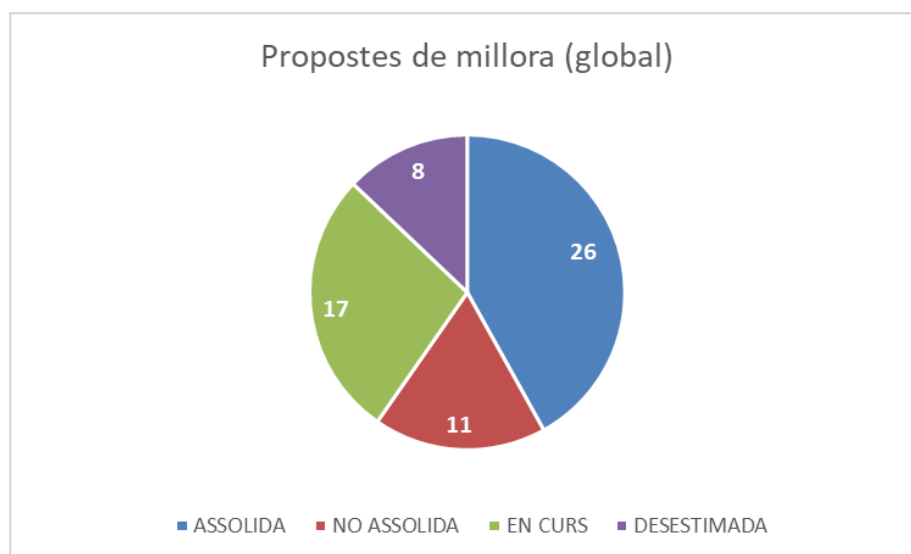
Gràfic 1. Seguiment de les propostes de millora del curs anterior (global)

El gràfic 1 mostra l'estat final de les seixanta-dues propostes de millora.